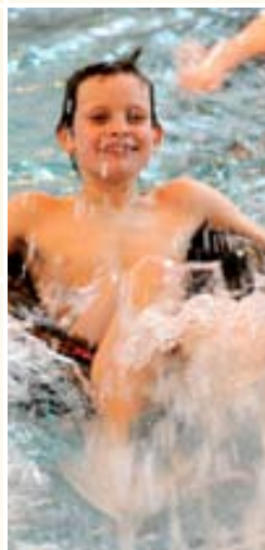
Behindertengerechtes Schwimmen ist im haus-eigenen Hallenbad des Viktoriastifts möglich.