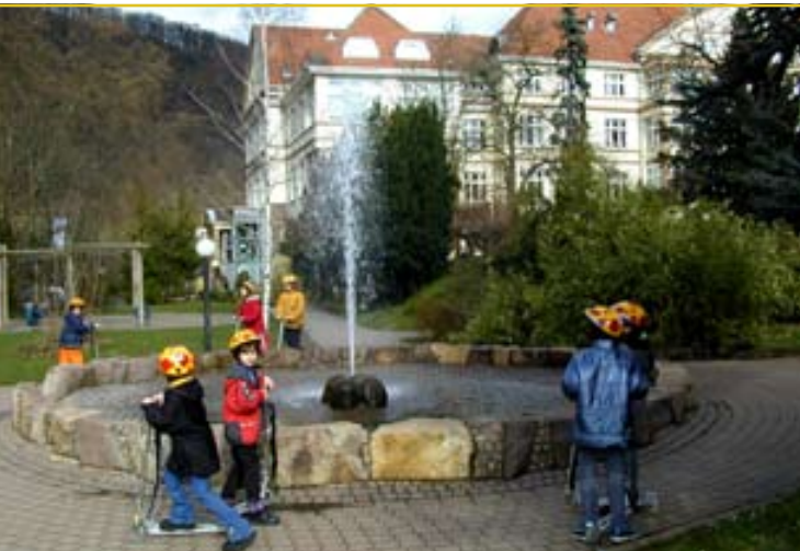
Idyllisch am Eingang des Salinentals gelegen befindet sich das Viktoriastift mitten im Grünen.